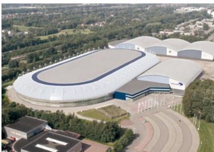
Renovatie Thialf huidige locatie