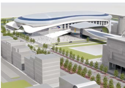
Nieuwbouw Thialf in Sportstadgebied variant Oost/West